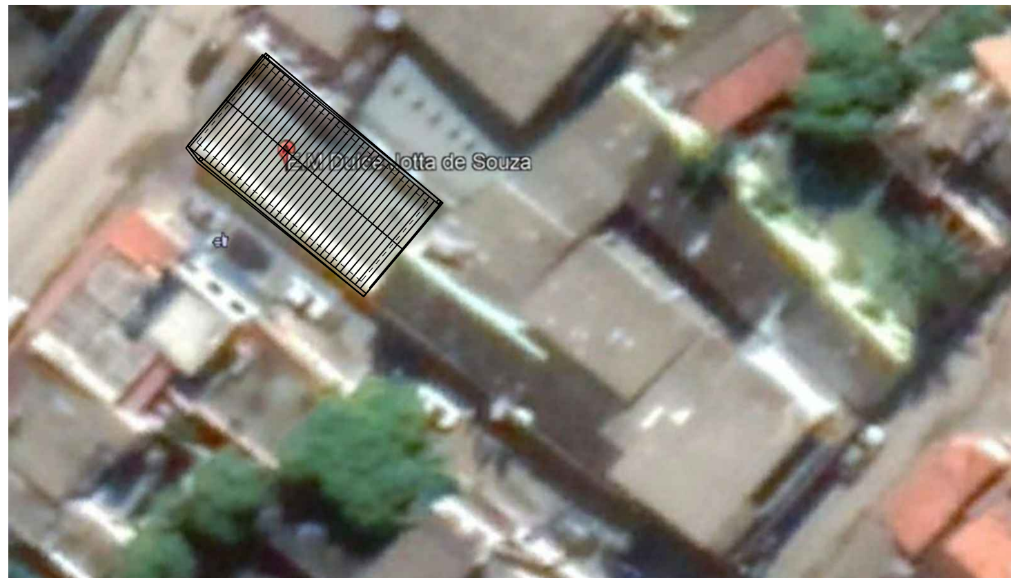
PLANTA BAIXA DE LOCALIZAÇÃO Sem Escala