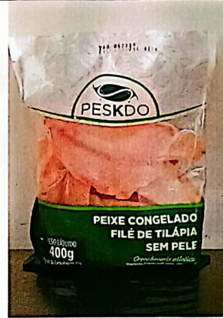
Figura 4 - Item 70 – Aprovado.