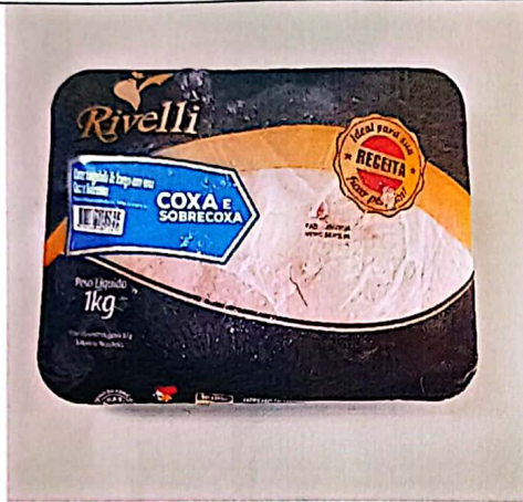
Figura 3 - Item 42 – Aprovado.