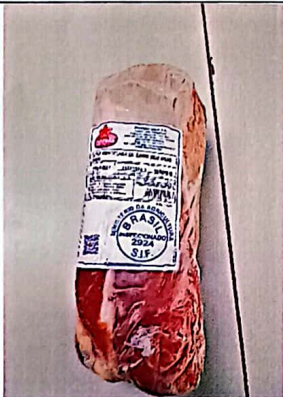
Figura 5 - Item 88 – Aprovado