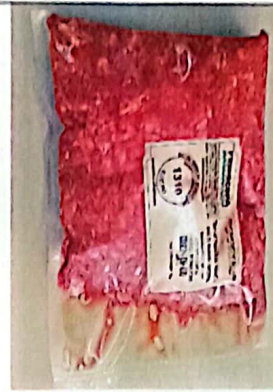
Figura 2 - Item 41 – Aprovado.