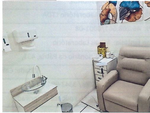
Sala de Coleta 1