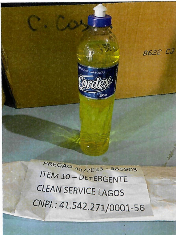
Figura 2 - Item 10 - Aprovado