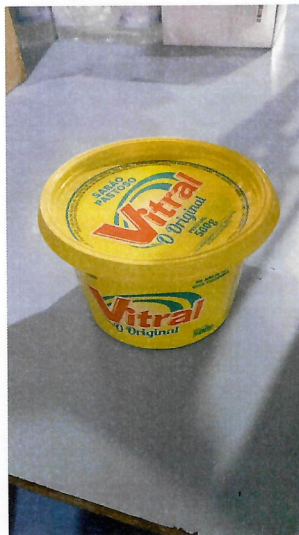
Figura 6 - Item 19 - Reprovado