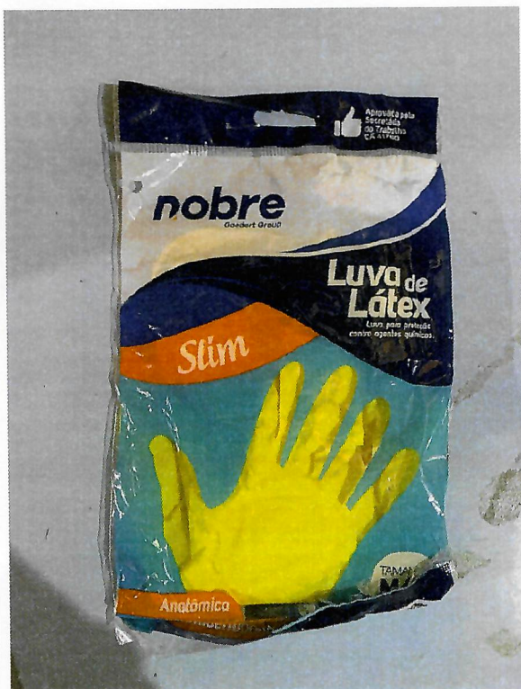
Figura 3 - Item 12 - Aprovado