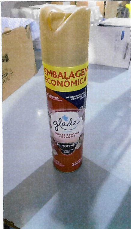
Figura 1 - Item 09 - Reprovado