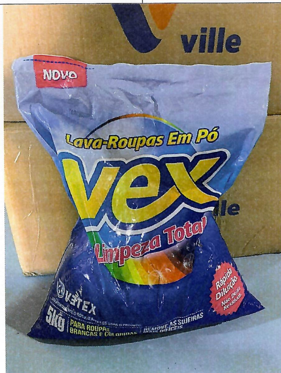
Figura 7 - Item 20 - Aprovado

[Handwritten signature] [Handwritten signature]