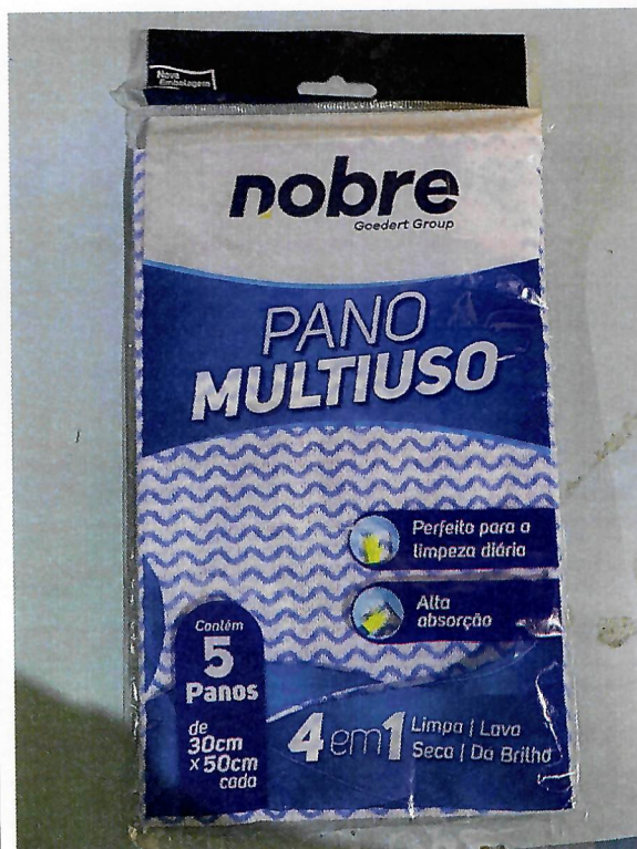
Figura 4 - Item 15 - Aprovado