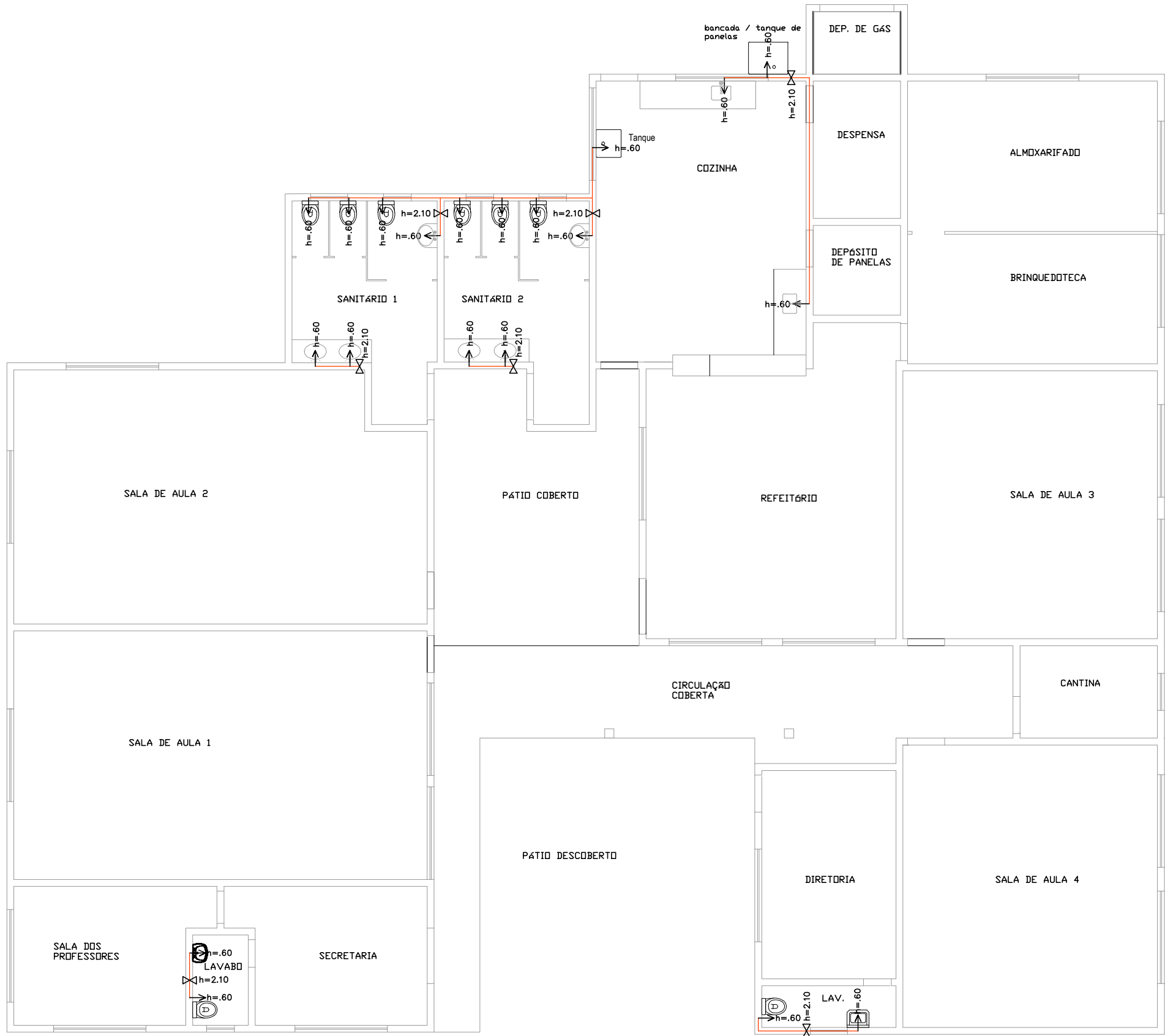
PLANTA BAIXA - TERREO ESCALA 1/100