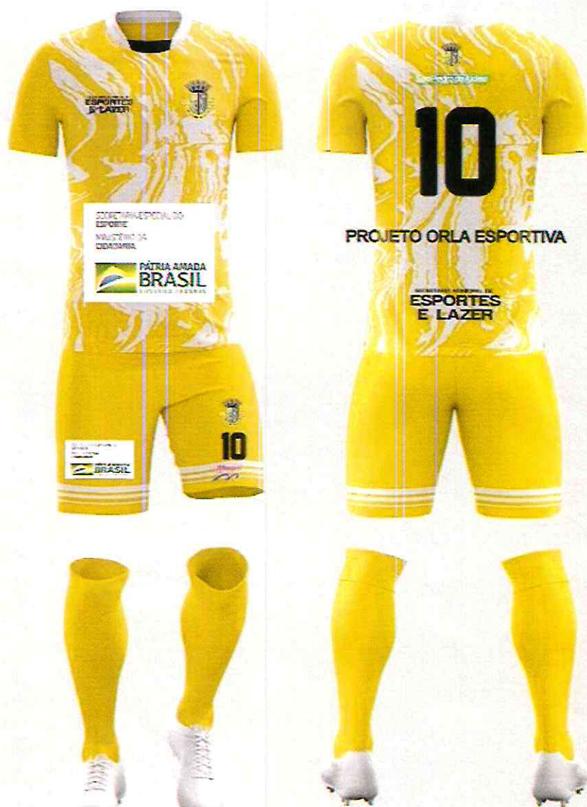
KIT UNIFORME – 96 KITS, TAMANHO M, COR AMARELO.

Proc. Nº: 968122 Folha Nº: 413 Rubr.: hdp