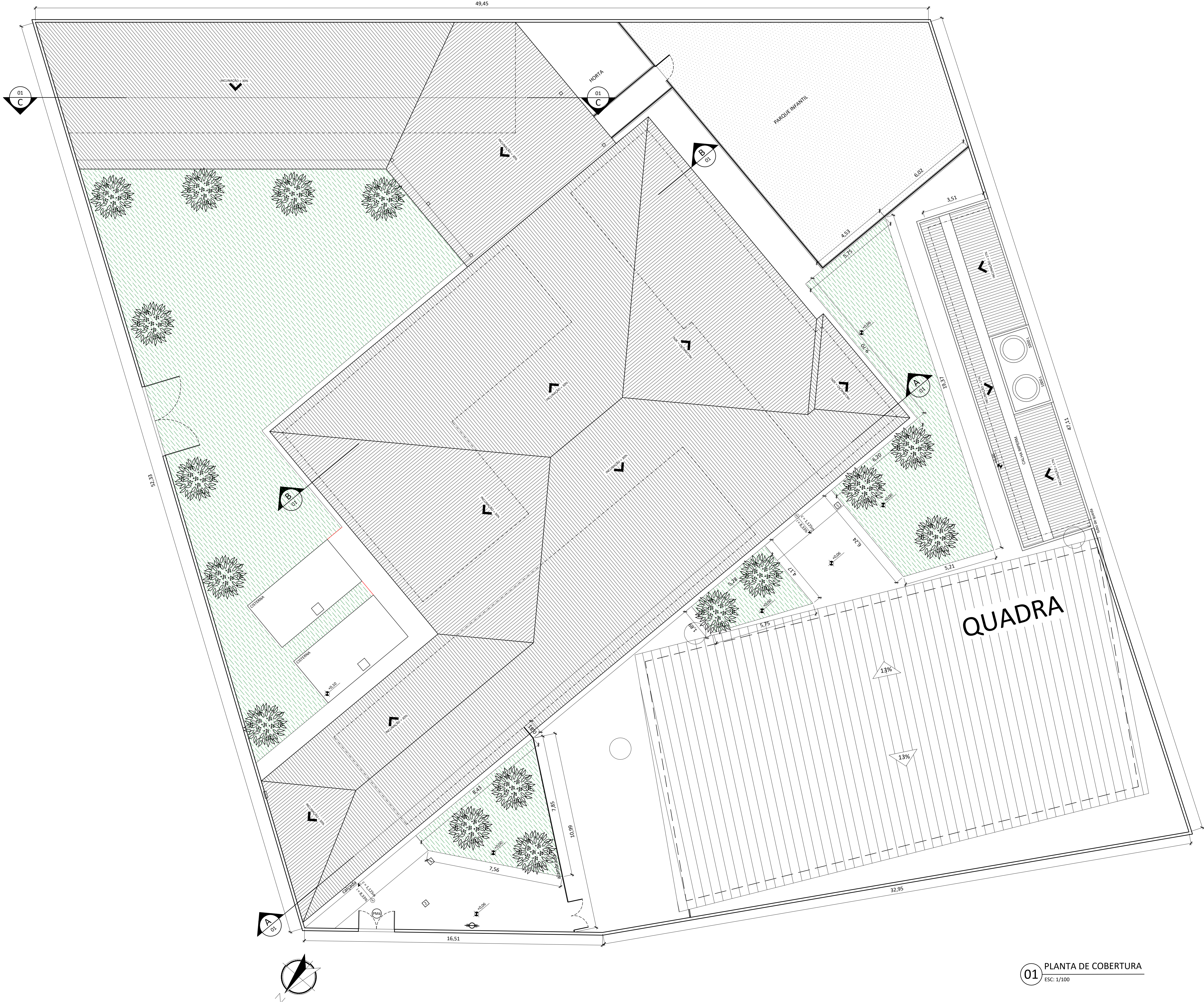
01 PLANTA DE COBERTURA Esc: 1/100